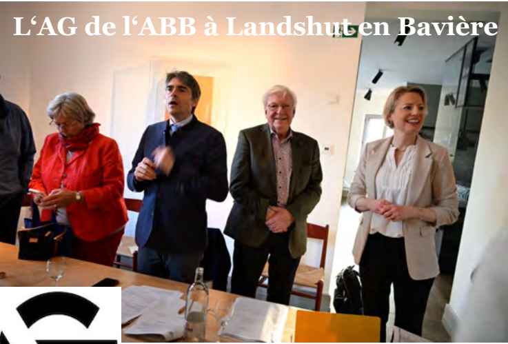
L'AG de l'ABB à Landshut en Bavière