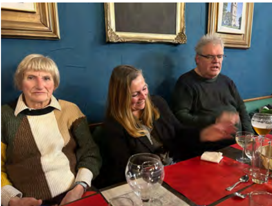
Excursion de l'ABB