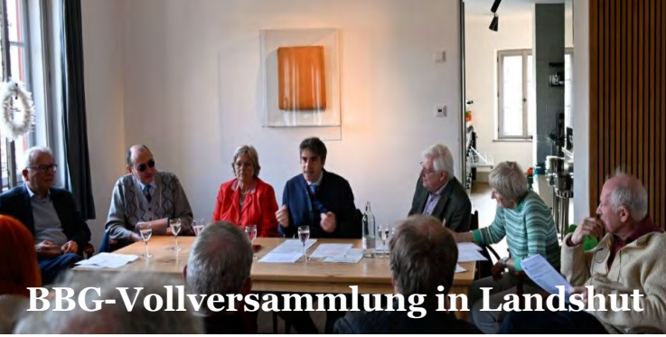
BBG-Vollversammlung in Landshut